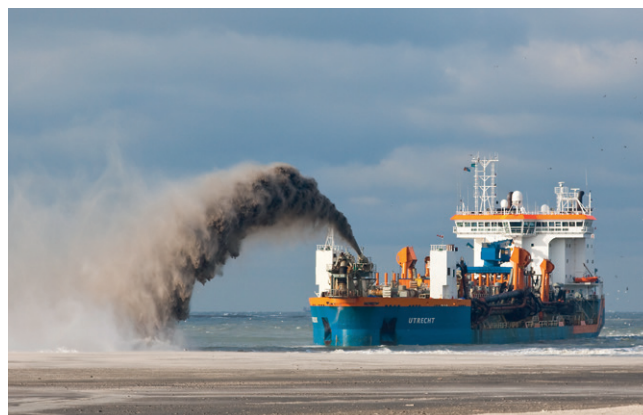
Waterbouwers aan het werk bij Maasvlakte 2.