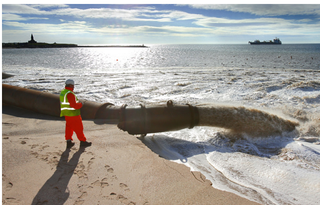
Een kubieke meter zand weegt 1.500 kilo.

■ 14. Waarom is er gekozen voor grof zand en niet voor fijn zand?