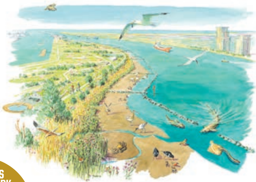
ILLUSTRATIE: ARK NATUURONTWIKKELING

gemaakt bij de Rozenburgse Landtong.' Van materiaal van onder andere oude glooiingen is inmiddels één kilometer 'langsdam' aangelegd, waarachter getijdennatuur kan opbloeien. En dat is nog maar het begin: de komende jaren wordt deze langsdam nog vier kilometer uitgebreid. 'De bouwsnelheid is afhankelijk van de beschikbaarheid van herbruikbaar materiaal. We willen de aanleg wel duurzaam houden.'