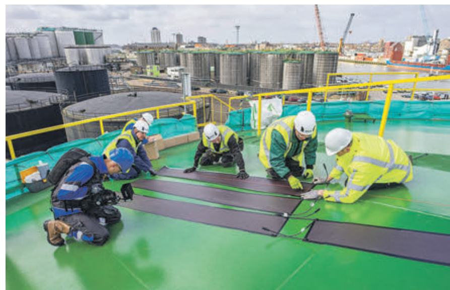
Solar powerfoil op een tankdak van Vopak.