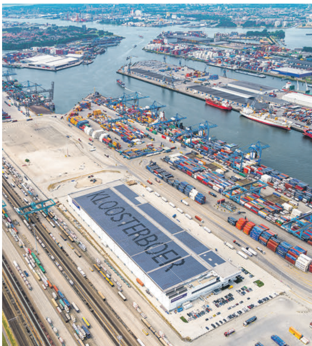
Op het dak van Cool Port vormt een aantal zwarte zonnepanelen samen het woord Kloosterboer.

Vanaf de grond zie je ze niet, maar ze liggen steeds vaker op daken van bedrijven in de haven: zonnepanelen. Goed nieuws: want de zon is een van de meest duurzame energiebronnen van de haven.