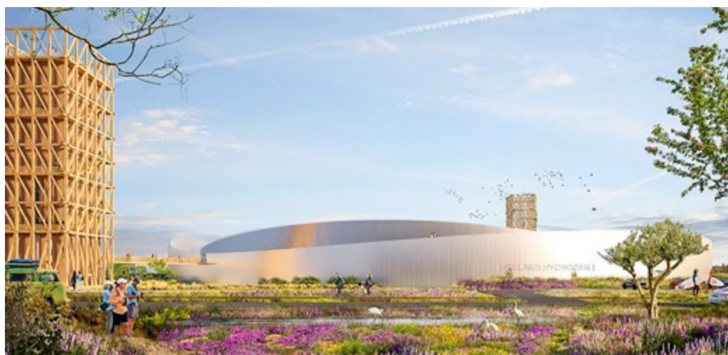
Ontwerpschets van de Holland Hydrogen I, de groene waterstoffabriek van Shell inclusief bezoekerscentrum op Maasvlakte 2. Geplande ingebruikname in 2024.

Op Maasvlakte 2 is een bedrijventerrein ingericht voor groene waterstoffabrieken. Ook wordt een grootschalig waterstofnetwerk in de Rotterdamse haven aangelegd. Wat is waterstof en waarom speelt het zo'n belangrijke rol in de toekomst van de haven? We leggen het uit.